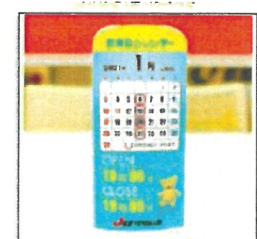
商談テーブル発信