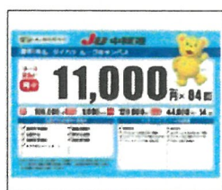
リース/ローン推進